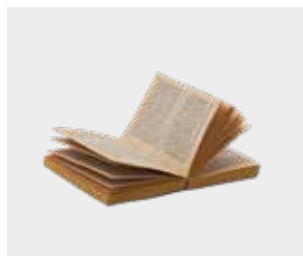
Cărți cu copertă necartonată (sau donează-le unei organizații de caritate)