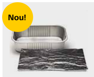
Folie de aluminiu curată și tăvi din folie