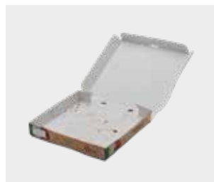
Cutii de pizza curate