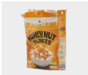
Cutii de cereale și învelișuri din hârtie pentru recipiente cu alimente