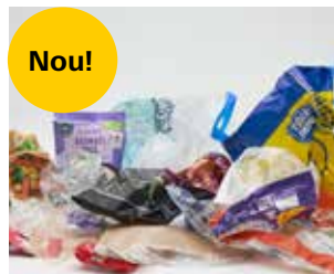
Plastice moi și folie de plastic (ambalaje de plastic, pungi de cumpărături, folie pentru cutii etc)