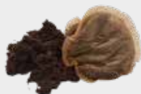
Pliculețe de ceai și zaț de cafea