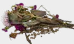
Flori, frunze și buruieni