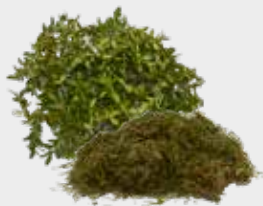
Resturi de iarbă și gard viu