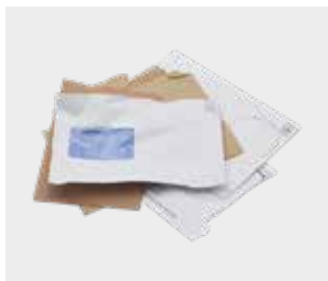
Plicuri și pliante nedorite