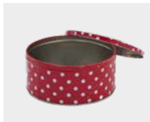
Cutii de metal și plastic pentru dulciuri și biscuiți