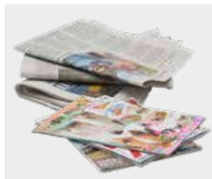
Ziare și reviste