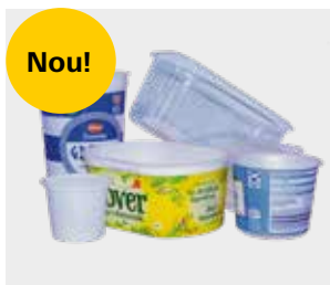
Ghivece, cutii și tăvi din plastic