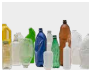
Sticle de plastic