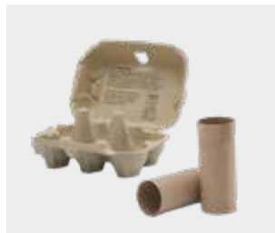
Cutii de ouă și tuburi de hârtie igienică