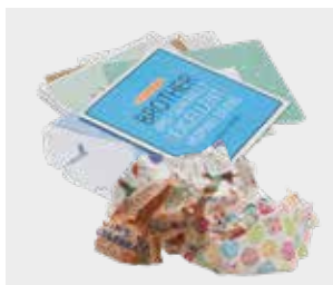
Felicitări și hârtie de împachetat