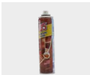
Tuburi de spray golite