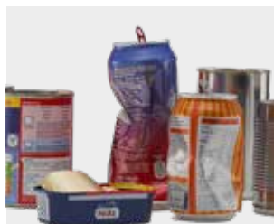
Doze și cutii de conserve