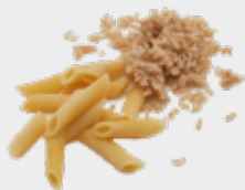
Orez și paste