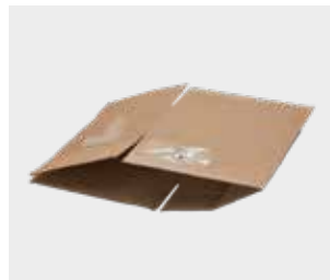
Cutii de carton