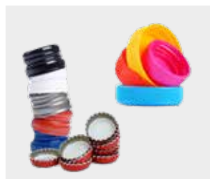
Capace și dopuri de plastic și metal