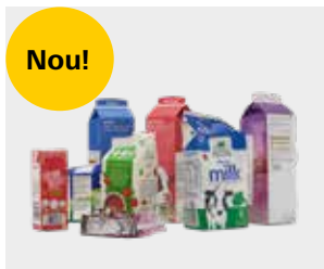
Cutii de carton pentru alimente și băuturi